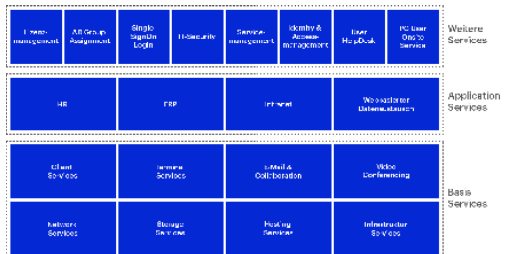
Abb. 2: Servicemodule

Das Full-Service-Paket der matrix beinhaltet neben den zentralen Basisdiensten verschiedene Anwendungen und weitere Services: